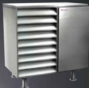
ExoAir / ExoAir Polaris