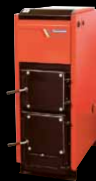
Exonom P20 UB