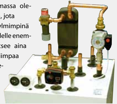
Kuva varaajasta kytkettynä keskuslämmitysjärjestelmään.

Varaaja voidaan liittää olemassa olevaan kaukolämpöverkoston, jota käytetään vain tarvittaessa kylmimpinä talvisäällä tai jos on käyttövedelle enemmän tarvetta. ExoTank valitsee aina edullisemman energian, kalliimpaa kaukolämpö energiaa käytetään vähimmäismäärässä. ExoTank SL voidaan liittää lämpöpumpuun, aurinkokennoihin, pellettikattilaan jne.